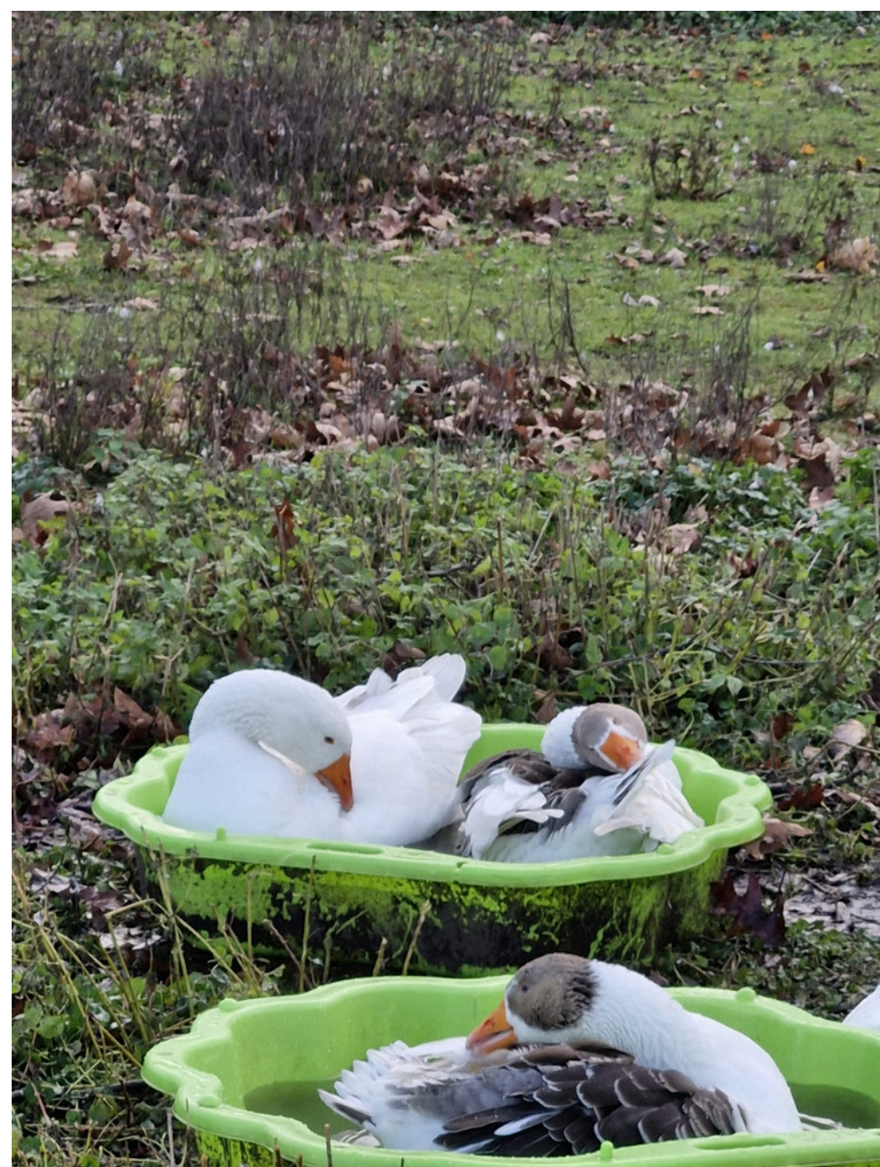
foto: ganzen van de kleuterschool in de Sportlaan

Maar één ding is zeker: op onze kleuterschool is er niet alleen veel te leren – er is ook veel liefde. Zelfs tussen onze ganzen.