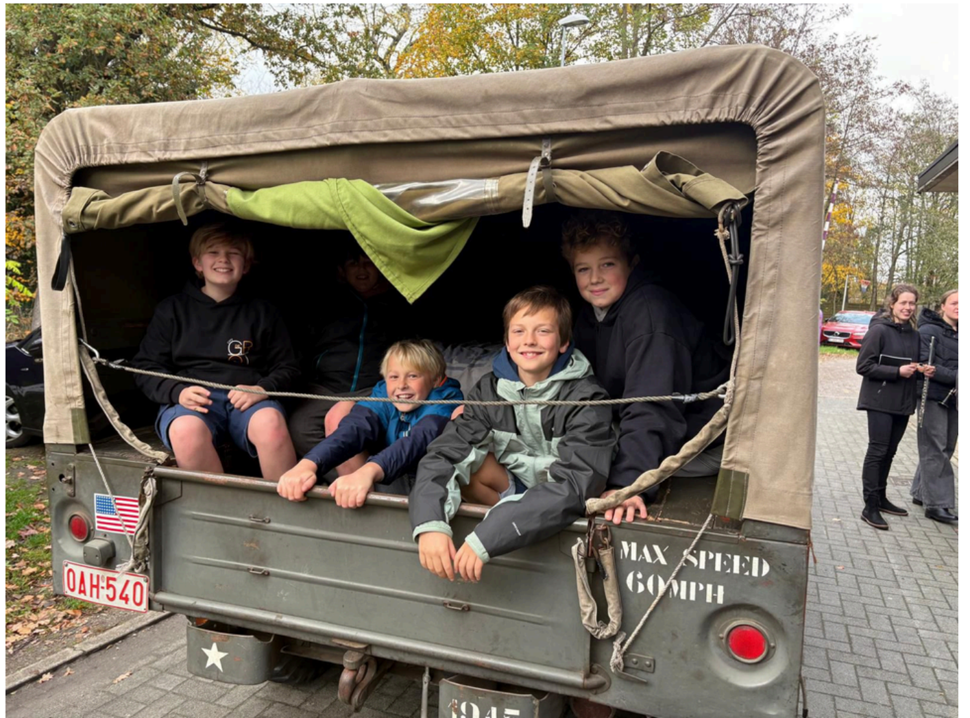
foto: leerlingen van het 6de leerjaar